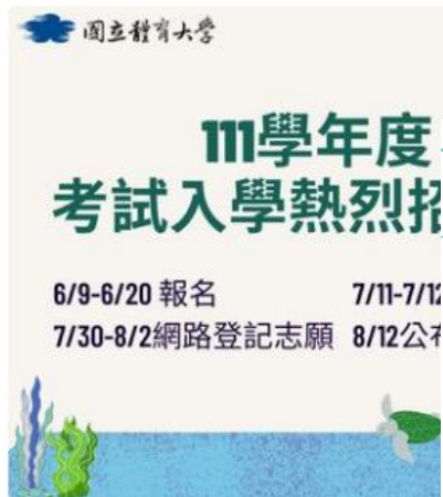
111學年度考試入學熱烈招生